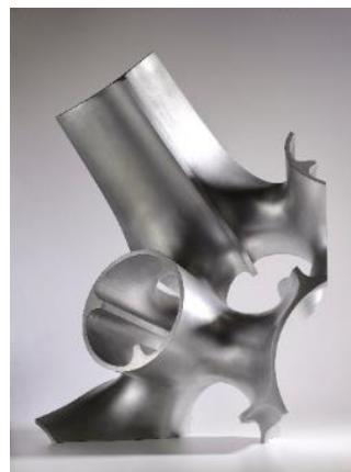
Florian Claar · No.5 (2022 Edition) · 2022 鋁 (7A) 50 x 65 x 45 cm · 6+2AP